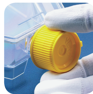
Posição para vedar ventilação