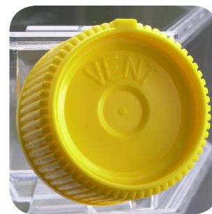
Posição para ventilar